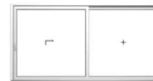
Schema A, DIN links 1 Hebe-Schiebeflügel, 1 Festverglasung