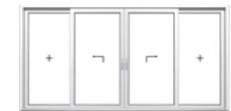
Schema C 2 Hebe-Schiebeflügel, 2 Festverglasungen