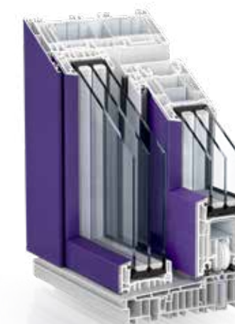
PremiDoor 76 Lux