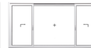
Schema K 2 Hebe-Schiebeflügel, 1 Festverglasung